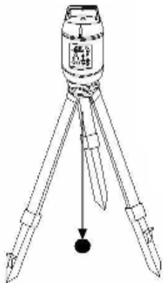
Рис. 1. Направление излучения лазерного луча ПВП RGK V200

Прибор вертикального проектирования RGK V200 предназначен для точного переноса точки в нади́р и зенит. Устройство оснащено источником лазерного излучения, который проецирует хорошо видимую точку на любой поверхности в пределах рабочей дистанции. Направление излучения лазерного луча показано на рисунке 1.