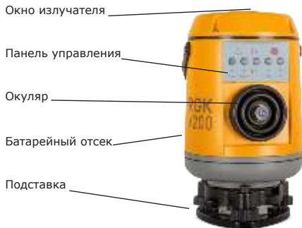
Рис. 2. Корпус устройства вертикального проектирования