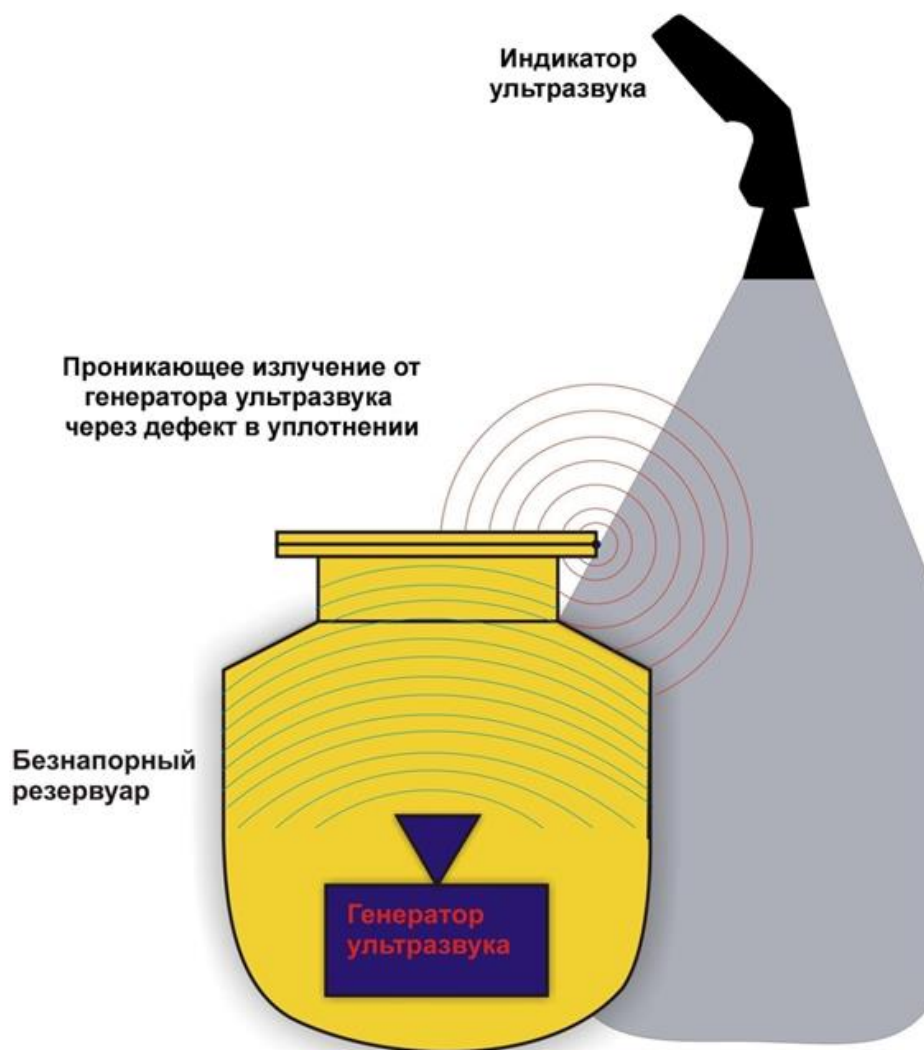
Контроль герметичности безнапорных резервуаров с помощью генератора и индикатора ультразвука

Принцип обнаружения негерметичности с помощью генератора и детектора ультразвука.