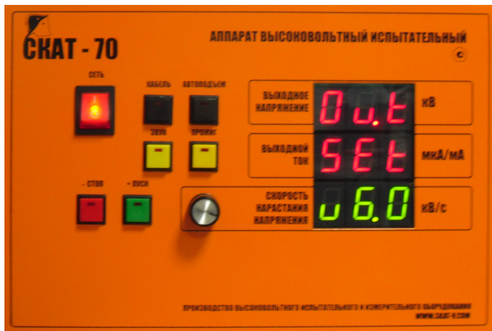
Рис. 2. Внешний вид передней панели измерительного блока.

светится десятичная точка, то сила тока отображается в миллиамперах, если десятичная точка не светится, то сила тока отображается в микроамперах.