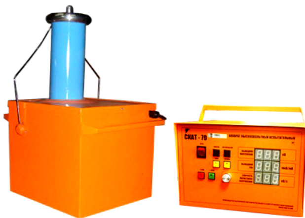
Рис. 1. Внешний вид измерительного и высоковольтного блоков.

Аппарат СКАТ-70 представляет собой переносной прибор, состоящий из двух блоков, высоковольтного и измерительного, которые соединены между собой кабелем. Внешний вид измерительного и высоковольтного блоков приведён на рис. 1.