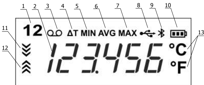
Рисунок 2 — Дисплей термометра

1.4.3 На рисунке 2 показан дисплей термометра.